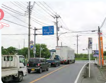
●田中交差点付近 深谷嵐山線 道路改築