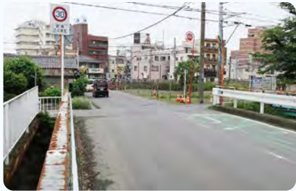
●西島踏切り付近 深谷寄居線 自転車歩行者道整備