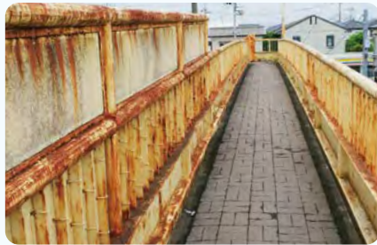
●桜ヶ丘歩道橋 深谷嵐山線 橋りょう修繕・塗装塗替