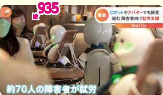
約70人の障害者が就労