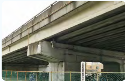
●深谷中央陸橋 深谷嵐山線 橋りょう修繕・断面修復