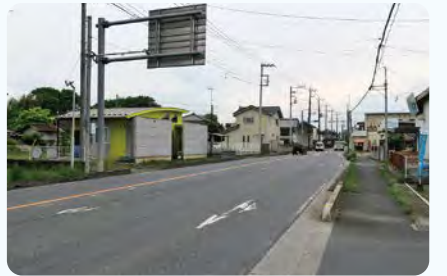
●本田道路改築 熊谷寄居線