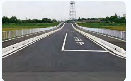
●榛沢通り道路改築 花園本庄線 【3月23日 暫定開通しています!】