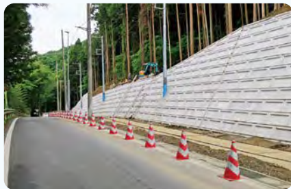
●円良田道路改築(I期) 広木折原線