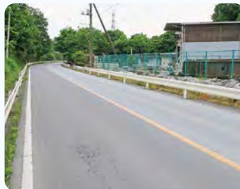
●本田小川線 舗装道整備