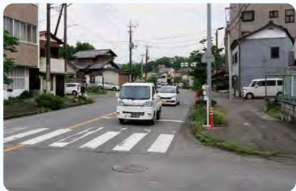
●飯能寄居線 寄居バリアフリー安全対策・波打ち改善