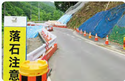
●円良田道路改築(II期) 広木折原線