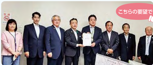
●5月10日 県道深谷嵐山線整備推進に対し、市長、議長、委員長、地元議員さんと共に県土整備部長に要望致しました。