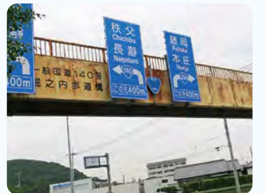
●堀之内歩道橋 国道140号(桜沢) 橋りょう修繕・塗装塗替