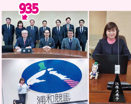
●1年間浦和競馬議会議員として活動しました!