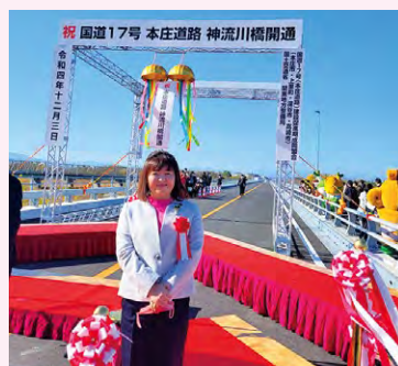
●国道17号本庄道路 神流川橋開通式!