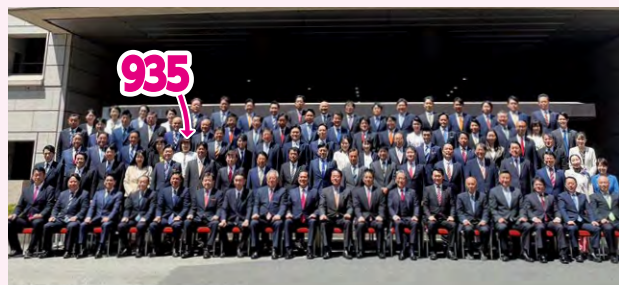
●新任期の始まりです。県議会議員93名の内、女性議員は15名となりました!