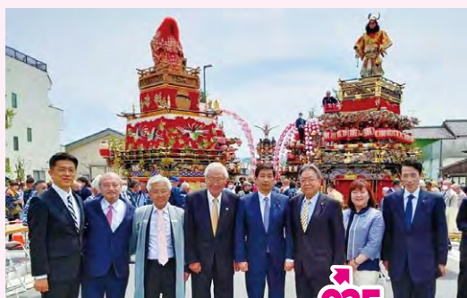
●令和の大改修 寄居宗像神社例大祭 全山車修復お披露目式典