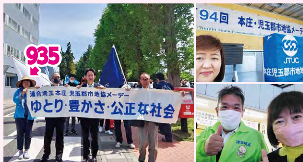
●埼玉県中央メーデー・本庄児玉郡市地協メーデー・街宣活動