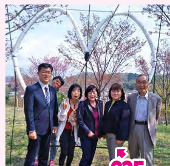
●各地の桜まつりへ