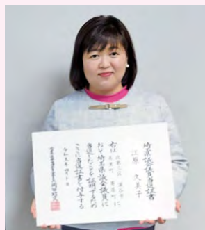
●当選証書授与式。3期目が始まります。