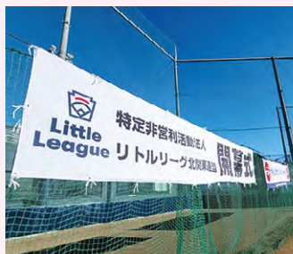
●リトルリーグ北関東連盟開幕式!