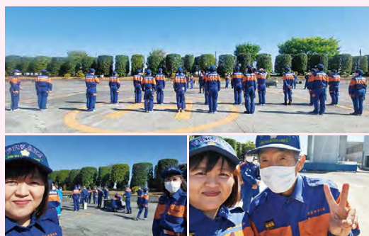
●消防団活動も継続中!