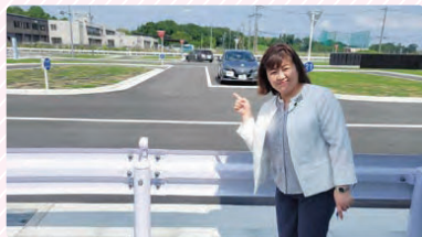
新規オープンした岩槻高齢者講習センターへ視察。是非ご活用下さい！