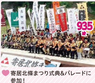
寄居北條まつり式典&パレードに参加！