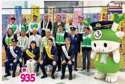
防犯のまちづくりキャンペーン@アリオ深谷