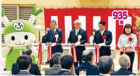
川本地区複合施設『ワモア川本』落成式