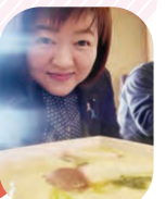
ジャンボ茶碗蒸し♡