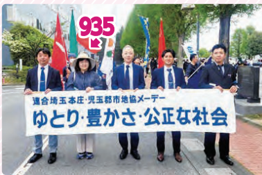
メーデー@鐘塚公園、メーデー@本庄児玉郡市地協デモ行進！