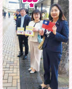
台湾東部沖地震被害者支援の募金活動