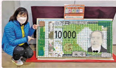
どこでも新一万円札のPRをしています！