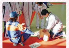
女性消防団活動も頑張ってます！