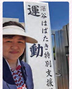
はばたき特別支援学校の運動会では8年ぶりの再会がありました！