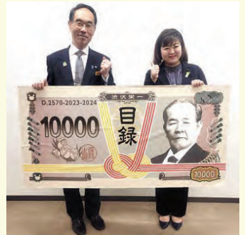
いよいよ新一万円札の発行です