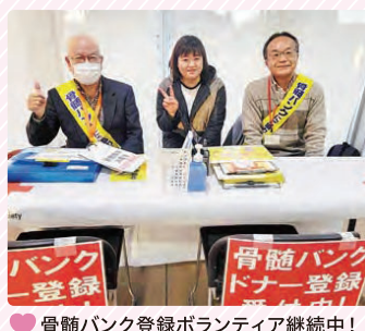
骨髄バンク登録ボランティア継続中！