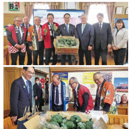
ブロッコリー指定野菜へ向けた知事への要望活動