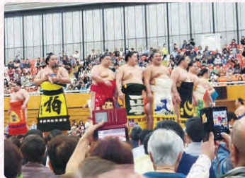
渋沢栄一—万円札発行記念の深谷場所開催！